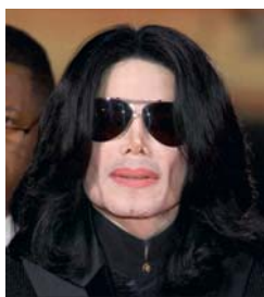
Michael Jackson 'De dokters zijn gezwicht voor z'n geld.'

KARAVANI: Toch als je ervan uitgaat dat een cosmetische behandeling iets is wat je voor je