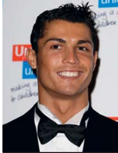
Cristiano Ronaldo 'De man is ook een lustobject geworden.'

persoonlijke ontwikkeling ondergaat. Stel dat je in een klein dorp woont waar iedereen je al sinds je geboorte kent. Dan zul je niet snel de neiging hebben om je plots anders te gaan gedragen of je uiterlijk te veranderen. Maar als je naar de grote stad trekt of via televisie of internet met de buitenwereld in contact komt, merk je natuurlijk meteen dat de mensen daar anders praten en er ook anders uitzien. Jou kennen ze niet en dus vraag je je af hoe ze jou zien. Je vergelijkt jezelf met fotomodellen, bekende Vlamingen en andere ideaalbeelden en zo ga je aan jezelf twijfelen. Waarom zien anderen je anders dan je bent? Wie ben je? Sommige mensen beginnen dan de kleren van bekende modeontwerpers te dragen omdat ze denken dat die hun identiteit bepalen, anderen komen bij mij terecht omdat ze iets aan hun gezicht willen veranderen.