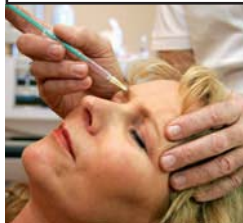
Botoxbehandeling 'Sommigen willen een gezicht dat niet meer kan bewegen.'