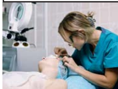
In huidkliniek Carpe 'Wie hier een behandeling ondergaat, kan de volgende dag gewoon weer aan het werk.'